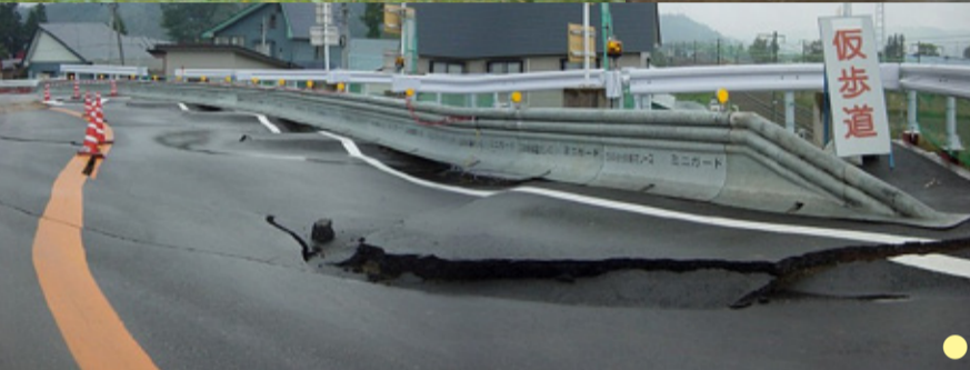
● 2011年3月11日 東日本大震災における浦安市の液状化被害 ● 2004年10月23日 新潟県中越地震による建物や道路の被害